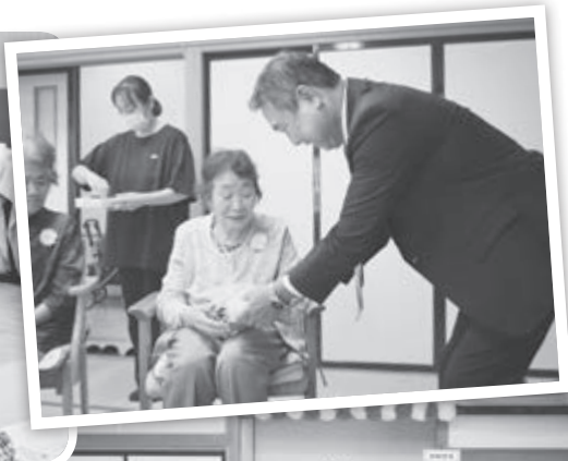
八郎潟町長からお祝いしていただきました。